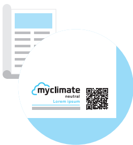
Label mit Trackingnummer