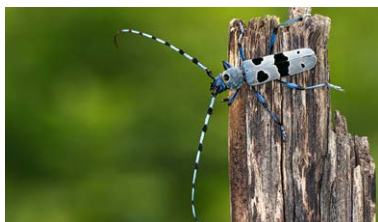
Schweiz Tier-, Natur- und Klimaschutz

Mit einem kleinen, auf Ihren Auftrag bezogenen Beitrag unterstützen Sie hochwertige myclimate Klimaschutzprojekte.