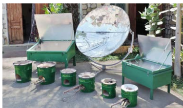
Madagaskar Solarkocher und effiziente Kocher