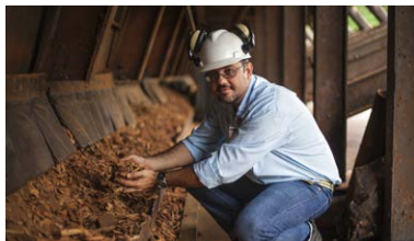
Brasilien Strom aus FSC-Holzabfall im Amazonas