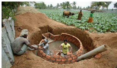
Indien Bau von Biogasanlagen